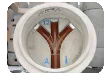
Typ Nr. 12

Vorrätig auf Lager: Schachtunterteile KÜHNE-IDEAL® DN 1000 mit Gerinne DN 150 Stzg.-Halbschale, oder Stzg. U-Schale Anschlüsse KG DN 150, Gerinne DN 100 Stzg.-Halbschale, Anschlüsse KG DN 100, Gerinne DN 200 Stzg.-Halbschale, Anschlüsse KG DN 200.