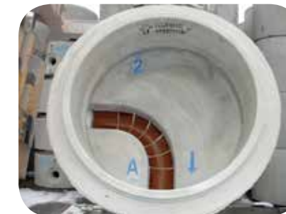
Typ Nr. 2