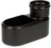
beruhigter Zulauf, Quelltopf