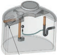
Filterplatte Typ A