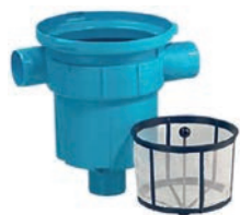
Gartenfilter / Basket 200