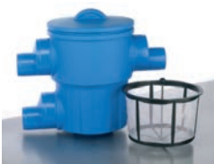
Gartenfilter XL / Basket XL