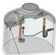
Filterplatte Typ A