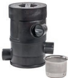
Wirbelfeinfilter Laub und Sand