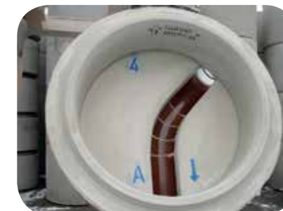
Typ Nr. 4