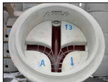
Draufsicht Typ 13

Leistungserklärung Nr. LE-001-13-1917-S-M gemäß CPR 305/2011/EU und ÜZ-11.242.00-4034-1