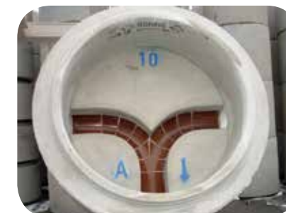
Typ Nr. 10