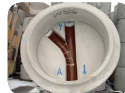
Typ Nr. 7