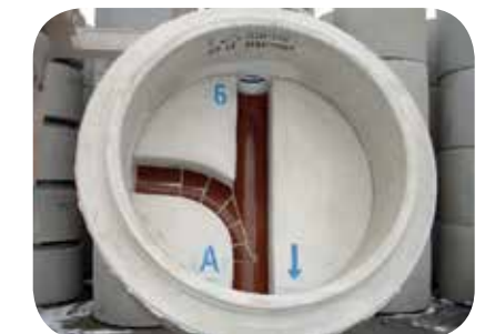
Typ Nr. 6