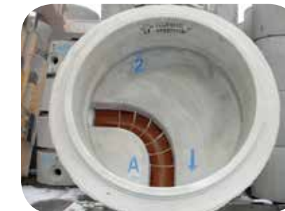
Typ Nr. 2