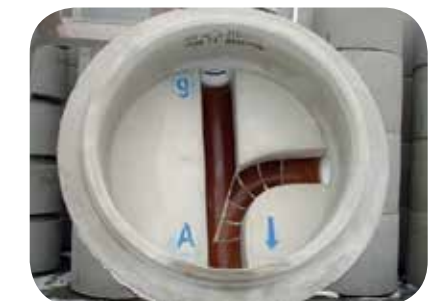
Typ Nr. 9