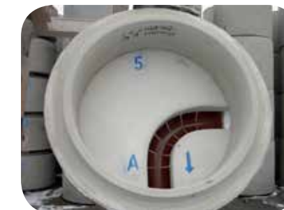
Typ Nr. 5