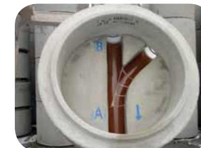
Typ Nr. 8