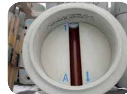
Typ Nr. 1