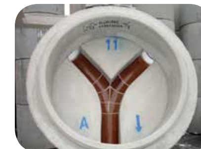
Typ Nr. 11