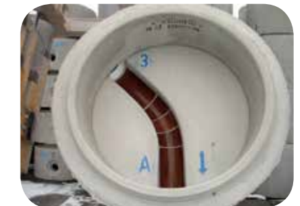
Typ Nr. 3