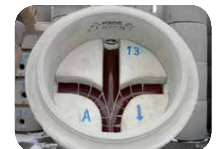
Typ Nr. 13

Legende: 1-13 : Typ Nr. 1-13: gerade, abgewinkelt, weiterer Zulauf A : Auslauf, ↓ : Fließrichtung