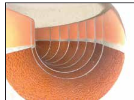
Stzg-Gerinne bis Scheitel, Berme gefliest

„Schachtunterteile SU-M KÜHNE-IDEAL® DN 1000, Art. Nr. 1151kg - 1195-95kg40: für wandverstärktes Schachtmaterial nach EN 1917 DIN V 4034/1, Typ 2, Nennweite 100 cm, Bauhöhe 65 cm oder 95 cm bis UK Muffe, Bodenstärke 21 cm bis Gerinnesohle, lichte Höhe ab Sohle Gerinne bis OK außen 44 cm oder 74 cm, Gerinne mit Steinzeughalbschale bis Kämpfer, bis Scheitel in Beton, Berme 1:20 in Beton, Wandstärke 15 cm, Gewicht 1,5 to oder 1,9 to, Typisierung: Nr. 1 – 13 und Sonderanfertigungen.