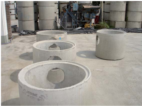
Inspektions- und Absetzschacht Fabrikat Kühne