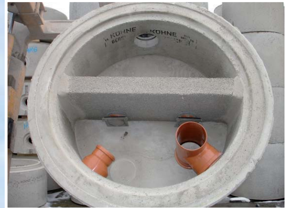
Laub- und Sandfang Fabrikat Kühne